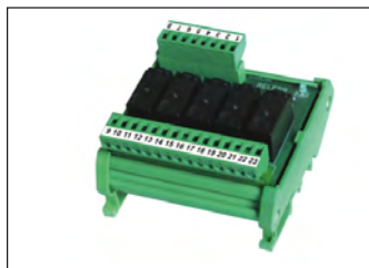
Modulo 5-relé esterno per aumentare la portata dei contatti di scambio a 2A/115Vac. External 5-relay module to increase the capacity of SPDT contacts to 2A/115Vac.