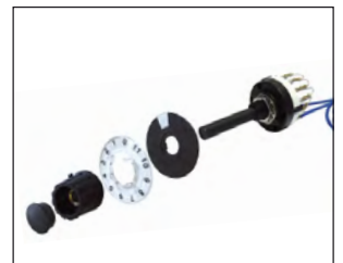
Commutatore per selezione 12 gruppi da 5 setpoint. Selector switch for 12 groups of 5 setpoint.