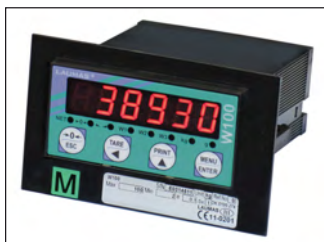
Supporto per etichetta metrica (dimensioni: 124 x 77 x 1.5 mm). Support for metric label (dimensions: 124 x 77 x 1.5 mm).